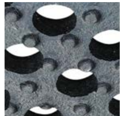
Noppen an der Unterseite